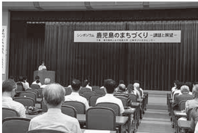
シンポジウム全景