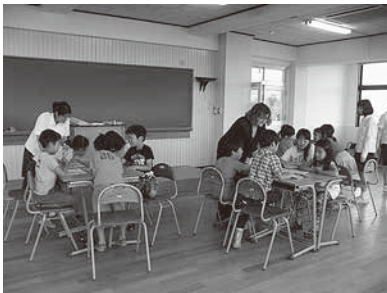
はじめての英会話（小学生コース）

今後とも「純心市民講座」が本学の研究・教育機能を活性化するとともに、市民の生涯学習に寄与し、本学と地域社会との交流の橋渡しとなることを切に願う次第である。