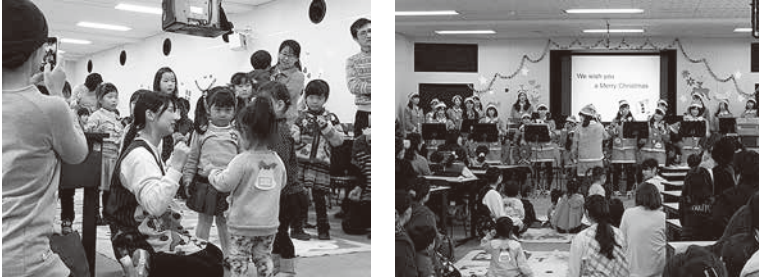
親子のお楽しみクリスマス会の様子

マス会」を実施し、クリスマスについてのお話、クリスマスにちなんだオーナメント作り、こどもバンドの演奏等を楽しんでいただいた。