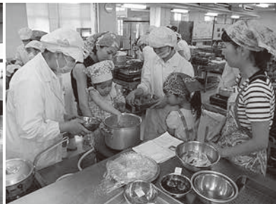
親子でクッキング