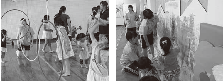
「リズムあそび」「いろとあそぼう・かたちとあそぼう」の様子

「リズムあそび」では、音楽やリズムに合わせて全身を動かす機会を提供した。本学体育館全体を使ったダイナミックな活動では、子どもたちが息をはずませて大きく活動する姿を目にする事ができた。「いろとあそぼう・かたちとあそぼう」では、こども講座でしか経験できない大きな作品作りの機会を提供した。会場いっぱいのスペースに、手や足、ローラーを使って描くなど、思い思いに表現する楽しさを経験していただいた。